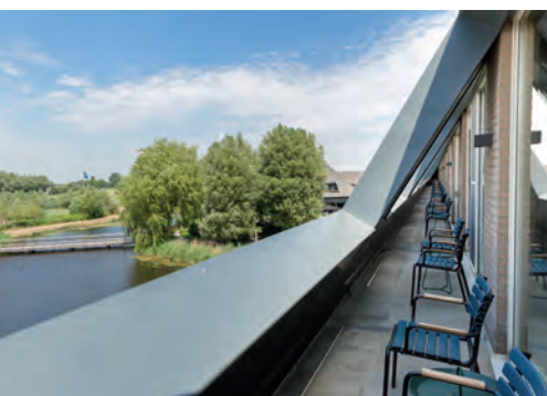
Terras Luxe kamer