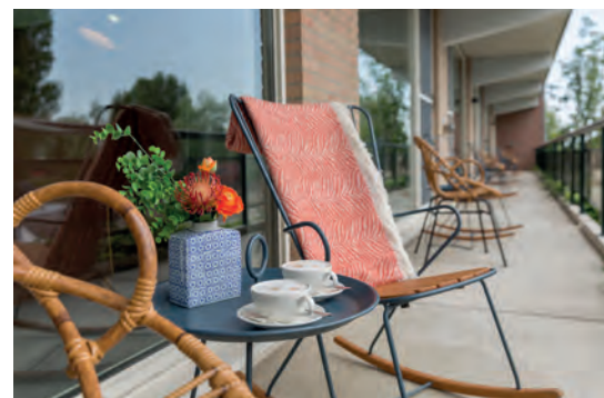
Terras Luxe kamer